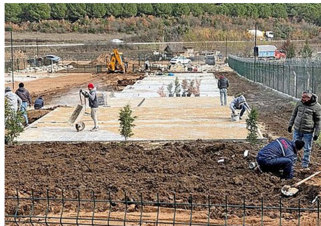
Der Bau des neuen Tierheims kann nun weitergehen.